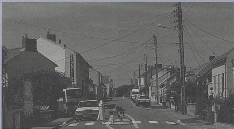
Dans les zones 30, le piéton est mieux respecté.

Pour limiter les risques d'accidents, la ville a mis au point un «schéma directeur des déplacements». Son principe : hiérarchiser les voies en fonction de leur usage et de leur circulation. Ainsi 3 catégories de route ont été distinguées : celle pour le transit inter-villes, celle pour le trafic inter-quartiers et la dernière pour la desserte interne des quartiers. A chaque catégorie correspond une limitation de vitesse : respectivement 70, 50 et 30 km/h.