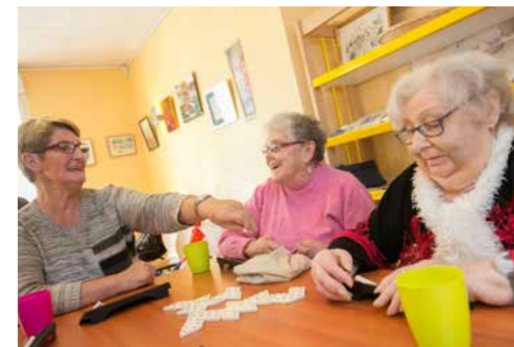
Liens croisés sort les seniors isolés de la solitude. >>

Rens. 06 46 55 30 53 lienscroises@gmail.com