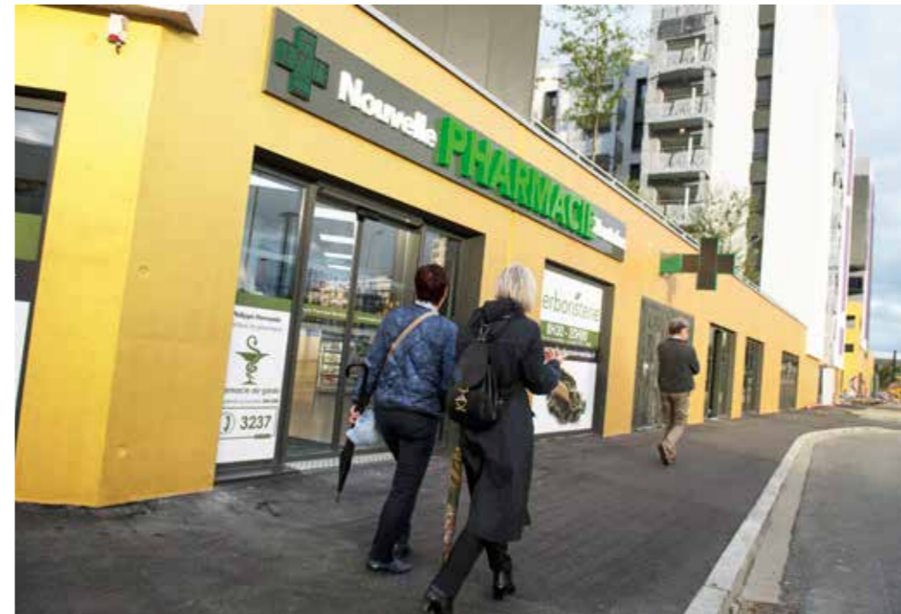
La Nouvelle Pharmacie nantaise, premier commerce installé dans le quartier Confluent.

À Confluent, les premiers habitants sont arrivés. Des premiers commerces également : une boulangerie et une pharmacie. D'autres commerces s'implanteront au fil de la construction du nouveau quartier d'entrée de ville.