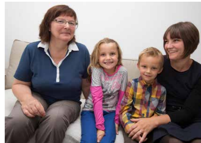
Manou Partages créent des liens intergénérationnels.

Partager son logement avec un étudiant. De plus en plus de seniors tentent l'expérience. Depuis trois ans, l'association Ensemble 2 générations donne naissance à des colocations intergénérationnelles au sein de la métropole. Le principe ? Un senior propose une chambre à un étudiant – parfois