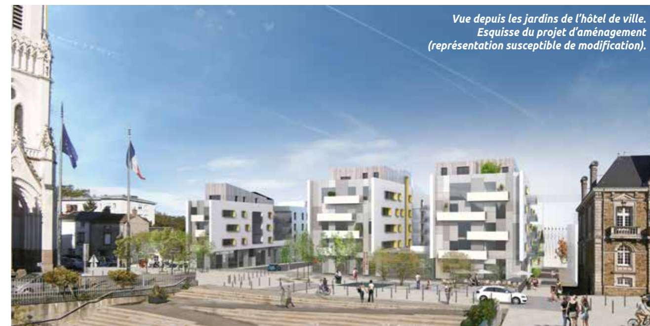
Vue depuis les jardins de l'hôtel de ville. Esquisse du projet d'aménagement (représentation susceptible de modification).

Le nouveau visage du quartier Rezé-Hôtel de ville se dessine. Le mois dernier, les habitants ont donné leur avis sur le projet d'aménagement d'une partie du vieux bourg de Rezé.