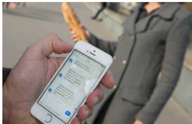
Avec Wello, aidez votre voisine qui ne peut plus se déplacer. Apportez lui le pain quand elle en a besoin.

Au CLIC, le guichet unique pour les plus de 60 ans. Centre social André-Coutant 12, rue des Déportés à Rezé Rens. 02 51 82 58 10