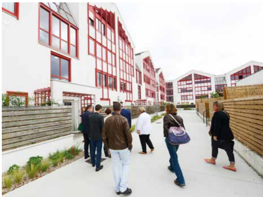
Les 133 logements de la résidence des Mahaudières aujourd'hui moins énergivores.

L'opération de rénovation énergétique des 133 logements de la résidence des Mahaudières a fait baisser les charges. Menée en concertation avec les locataires, elle s'est accompagnée d'une mise en valeur des espaces extérieurs.