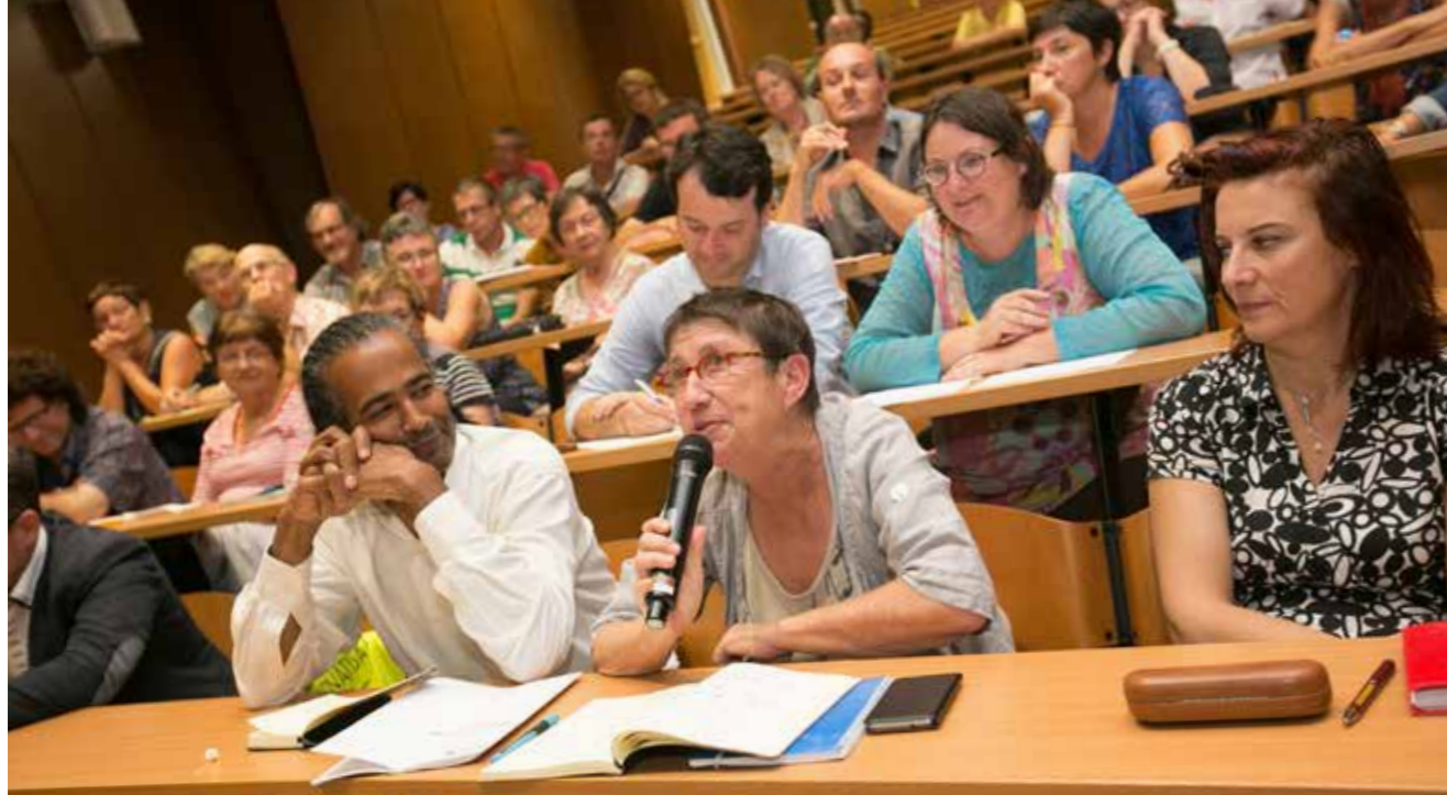
La Ville de Rezé met en place de nouvelles formes de dialogue avec les habitants. Parmi elles : les Dialabs, des espaces pour échanger avec d'autres habitants de votre quartier, autour de sujets que vous avez choisis.