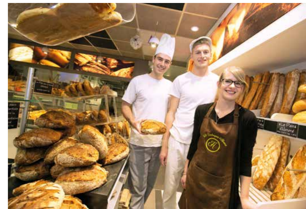
Les habitants du quartier Confluent ont leur boulangerie d'Honoré.