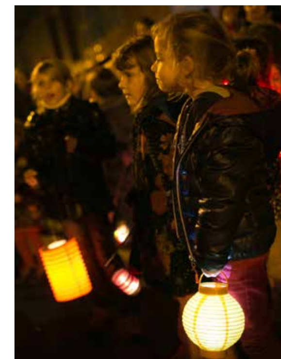
Défilé aux lampions, le 16 décembre.