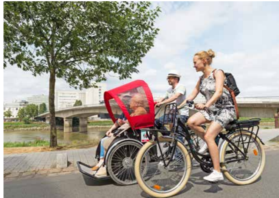
Un tour en pousse-pousse amélioré avec A vélo sans âge.