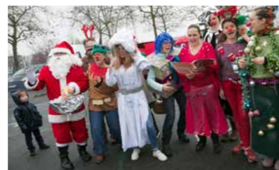
Ragon'Neige, du 16 au 18 décembre.