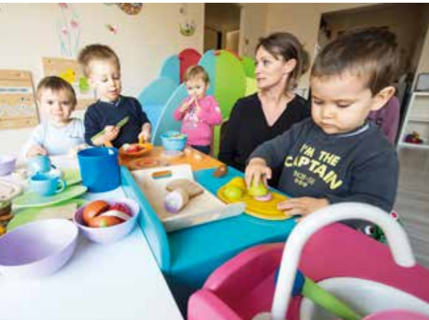
Les enfants sont comme à la maison à la microcrèche Les Pieds dans l'eau.

La microcrèche privée Les Pieds dans l'eau accueille des enfants depuis mars dernier au 50 de la rue Blanchet. « Dix au maximum par jour, c'est un format très intimiste », souligne Jérémie