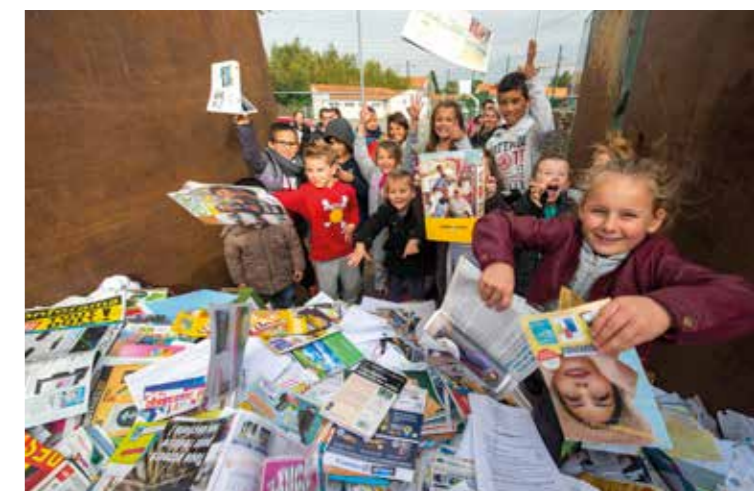
Plus de cinq tonnes de papier récoltés à l'école du Chêne-Creux.